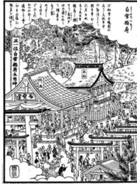
出典 国立国会図書館デジタルコレクション 尾張名所図会前編巻2 愛智郡

によれば、当時は境内北側、現在の三輪神社の南あたりに祀られていたことが記されています。また万松寺と所縁ある大道寺家の用人を務めた水野正信が記した『青窓紀聞』によると文政元年に社殿の修復と棟上げが行われ、祭礼は夜まで大いに賑わったと記されており、その賑わいは、当時の人々の篤い信仰を物語っているようです。